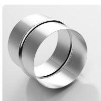
Conexão de mangueira Conector em chapa de aço para estender, conectar e unir mangueiras leves a de peso médio.