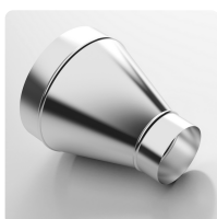
Redutor de mangueira, simétrico Redutor de mangueira para estender, conectar e unir mangueiras leves a de peso médio.