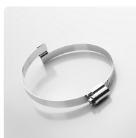
Clip-Grip Abraçadeira, aparafusável Abraçadeira especial para fixar todos os tipos de mangueiras da série Master-Clip a equipamentos móveis e estacionários